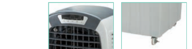
Afisaj digital cu comenzi electronice si detector de temperatura la evacuarea aerului