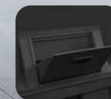
Duza rezervor de apă pentru umplerea manuală.