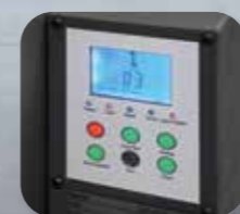
Ecran digital cu control electronic