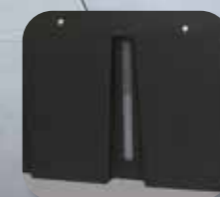
Rezervor cu control vizual al nivelului apei