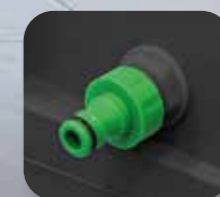
Conectare automată la rețeaua de apă