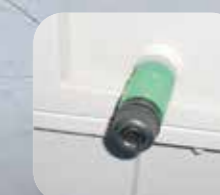
Conectare automată la rețelele de apă