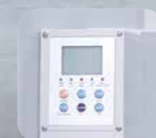
Ecran digital cu control electronic