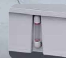
Rezervor cu control vizual al nivelului apei