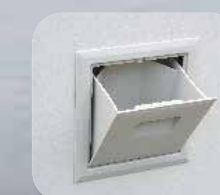
Duza rezervor de apă pentru umplerea manuală